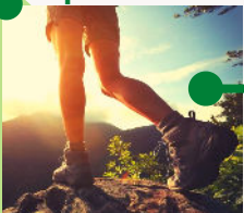
Calçat específic de muntanya