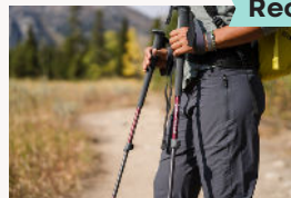
Bastons de tresc